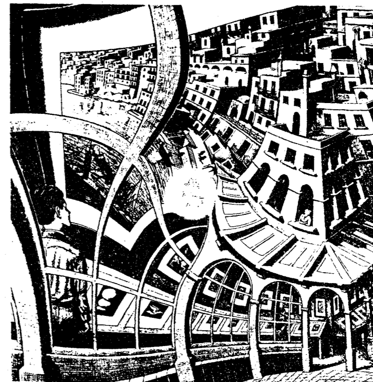
Litografi av M C ESCHER

Den som inte ser sig själv och sin situation kan fastna i handlingsmönster som han inte kan ta sig ur. Det kallas perseveration = ett automatiskt, stereotypt upprepande av samma handling. Perseveration är ett typiskt symtom vid skador i hjärnans frontallob. Rumpnissarna i sagan om Ronja rövardotter utmärks av insiktslöst och perseverativt beteende. De är som människor utan FF.